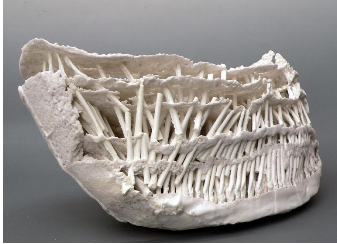
Le gisant blanchi, 2007