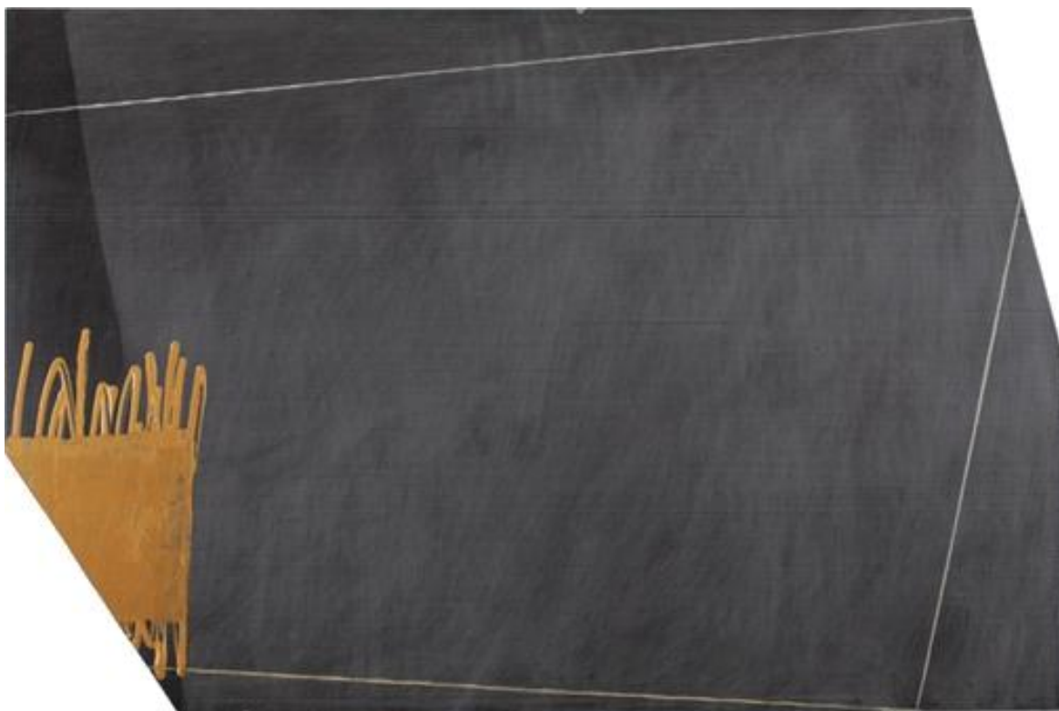
Sans titre, acrylique sur plaque de polypropylène découpée, 120 cm x 80 cm, 2014