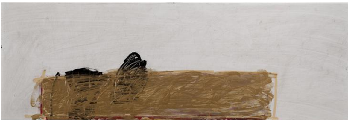
Sans titre, acrylique sur plaque de polypropylène découpée, 40 cm x 120 cm, 2014