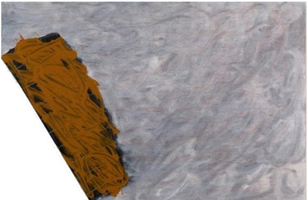
Sans titre, acrylique sur plaque de polypropylène découpée, 120 cm x 80 cm, 2013