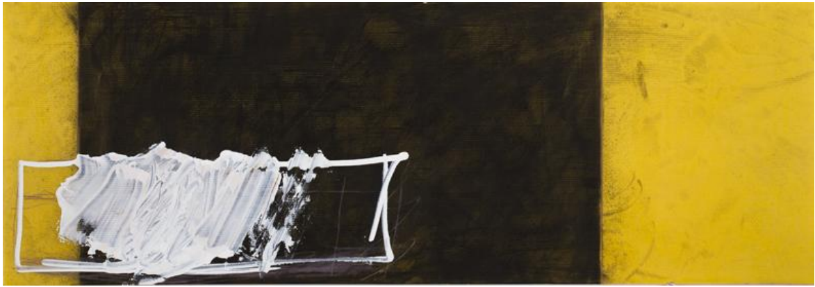
Sans titre, acrylique sur plaque de polypropylène découpée, 40 cm x 120 cm, 2014