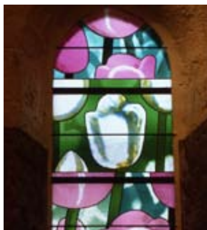
Eglise Saint-Sulpice de Varennes-Jarcy

Eglise Loppiano ; Eglise Villenauxe ; Saint-Sulpice de Varennes-Jarcy ; Cathédrale Palma de Majorca.